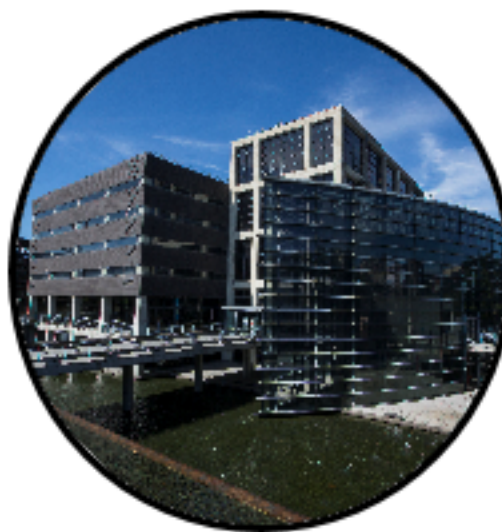
新北市立鶯歌陶瓷博物館